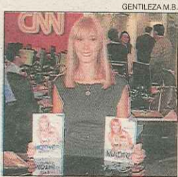
FELIZ. En los estudios de CNN, en EE.UU.